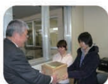
静岡県立 静岡中央高等学校