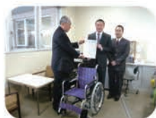
(株)マルハン中之郷店

現金・葉書・切手など 138件 2,280,343円 物品寄付(プルタブ、使用済み切手、ベルマークなど) 565件 プルタブ 580kg (換金額 47,500円 )