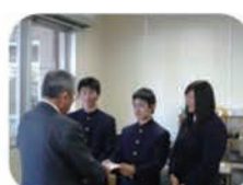
静岡県立 湖西高等学校