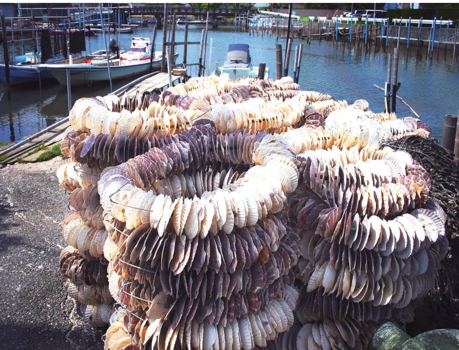
浜名湖産養殖牡蠣の種とおし（新居の船着場）