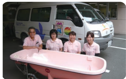
浴槽を積んだ車両で訪問入浴

介護保険制度における居宅介護支援事業、 訪問介護事業、訪問入浴介護事業・通所介護 事業、障害サービス（居宅介護）事業を行いま した。