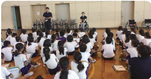
小学校における福祉教育