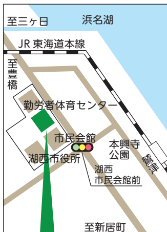
湖西市健康福祉センター おぼと

事務局 ☎594-5511 / 594-7771 湖西市社協介護センターあらい 居宅介護支援事業所、通所介護事業所 ☎594-5000 / 594-7771