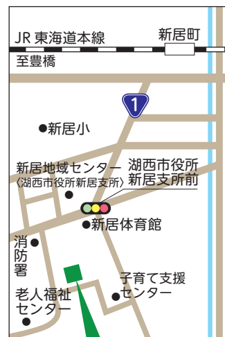
新居介護サービスセンター