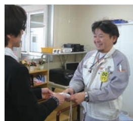
ユニバンス労働組合