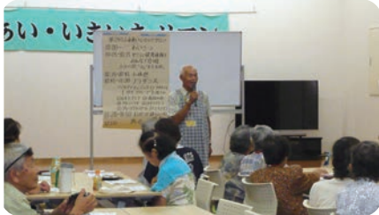
ふれあい・いきいきサロン

「住みなれた地域でみんなで支え合い みんなで築く福祉のまちづくり」 を目指しさまざまな事業や活動を実施しました。 左ページの支出内訳に関連した事業の一部を紹介します。