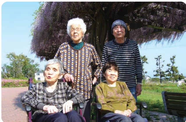
機能訓練を兼ねて外へお散歩

「人生の先輩を大切にしよう！」をモットーに、ご利用者の皆さんの笑い声と職員の笑顔がたっぷりの明るく元気な社協のデイサービスです。