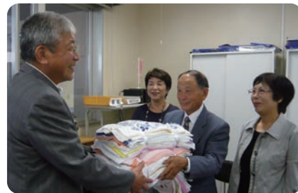
静岡県退職公務員連盟浜名支部