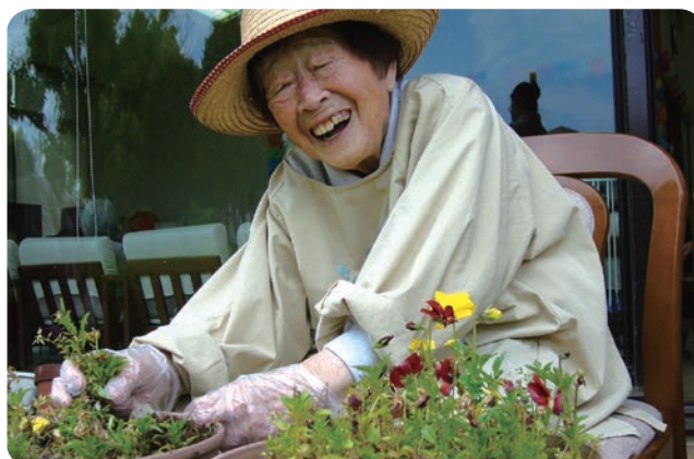
中庭は野菜やお花でいっぱい！！