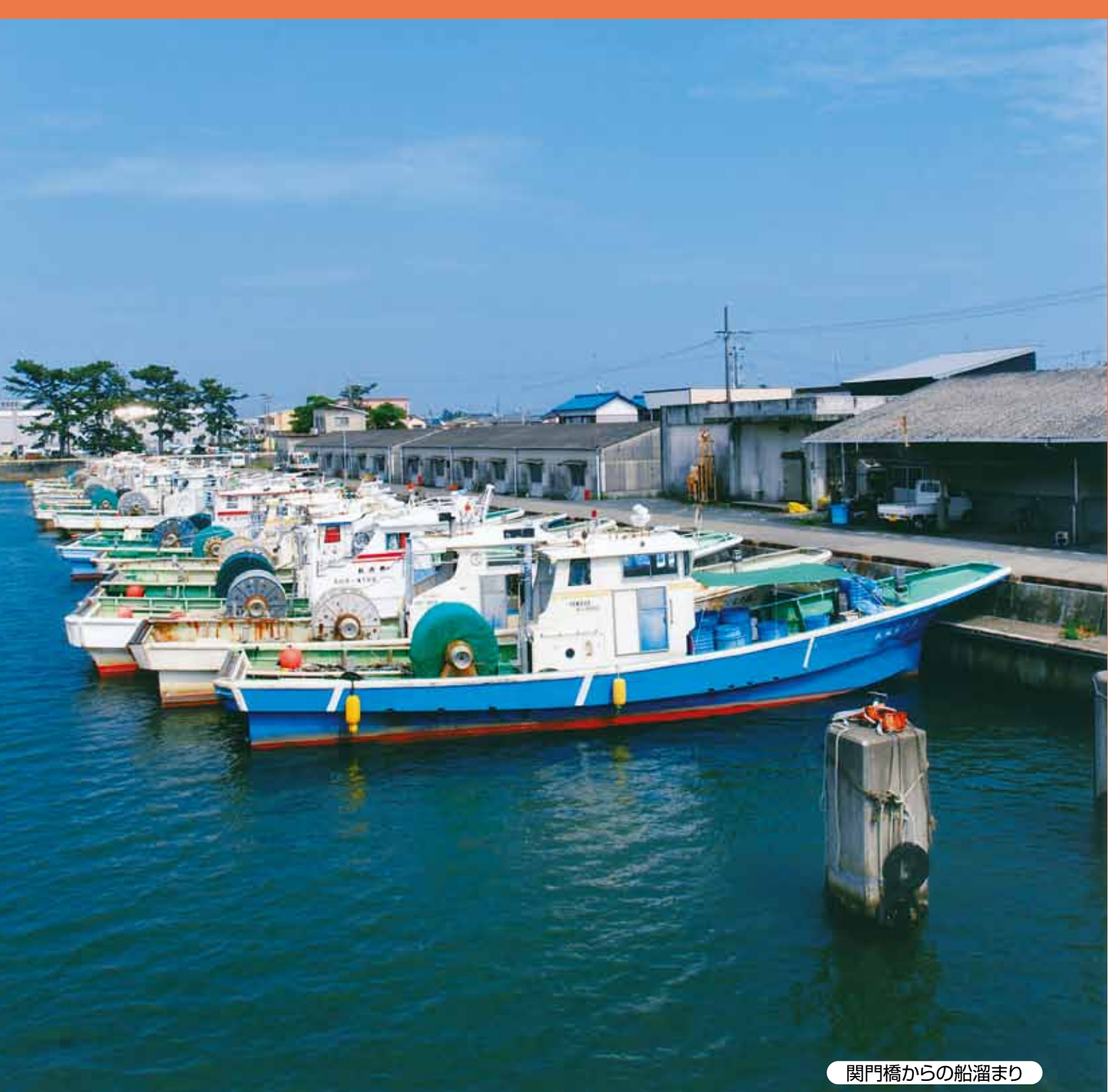
関門橋からの船溜まり