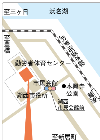
湖西市健康福祉センター おぼと