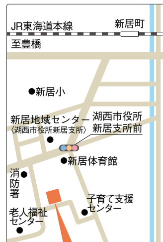
新居介護サービスセンター