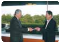
サハラ開発株式会社