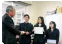
静岡県立湖西高等学校