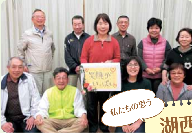
おしゃべりサロン(南上ノ原)