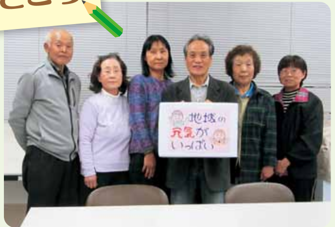
湖西市回想法サポータークラブ