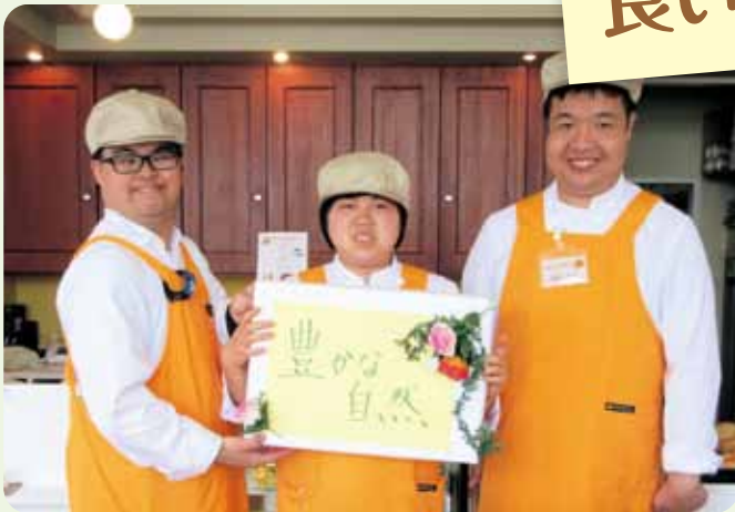
ひまわりカフェ(新所原)