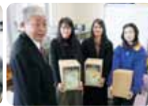
静岡中央高等学校