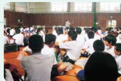
ボランティア体験