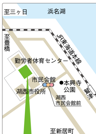
湖西市健康福祉センター おぼと

湖西市社協 介護センターあらい 居宅介護支援事業所、通所介護事業所 ☎594-5000 / ☎594-7771