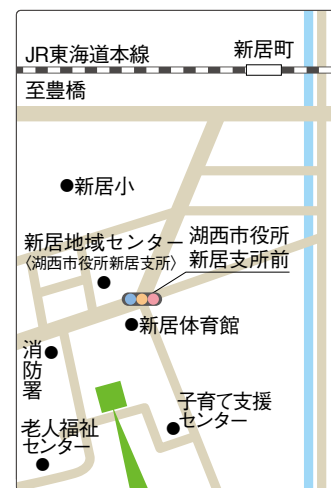
新居介護サービスセンター