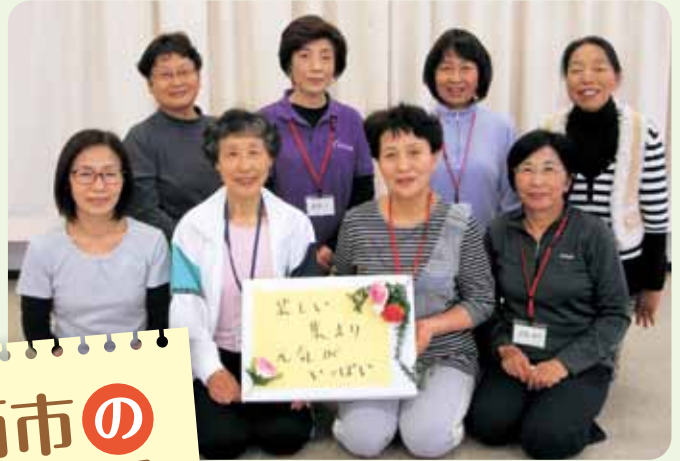
表鷲津健康体操リーダー