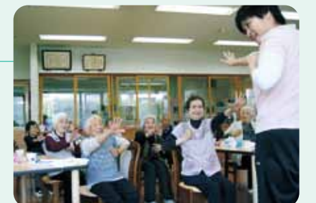
デイサービス こぶくちゃん教室

※①生活支援体制整備事業とは、地域で高齢者の在宅生活を支援するため、地域に生活支援コーディネーター及び協議体を設置し、介護保険制度でのサービスだけではなく、市町の事業や地域で行われているサービスなど、市町内の「資源」を把握しつつ、介護保険外のサービスの活用を推進し、生活支援・介護予防サービスが創出されるような取組を推進する事業です。