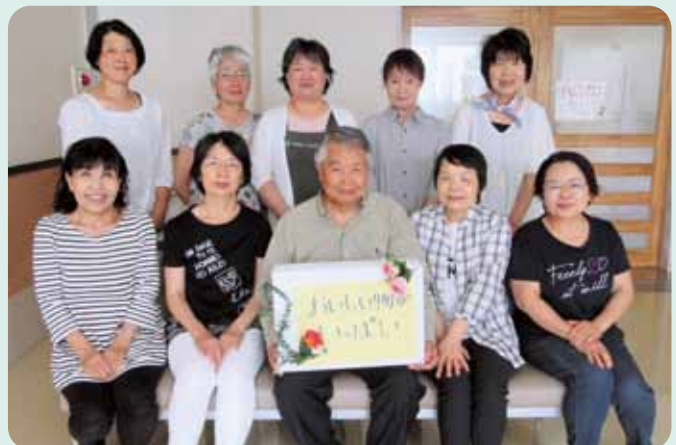
河美地区福祉会(役員・リーダー)