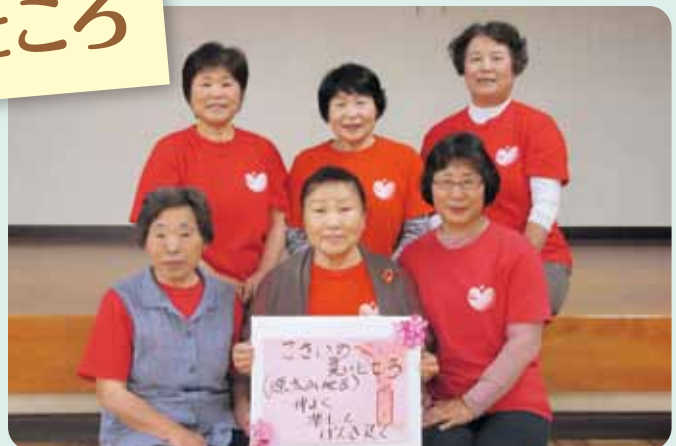
源太山健康体操リーダー