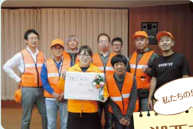
新居町災害ボランティア