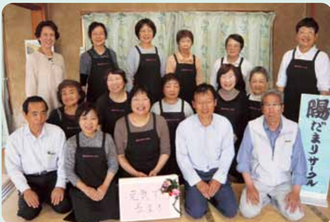
陽だまりサークル(新所・居場所)