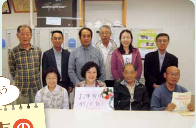
湖西市災害ボランティア