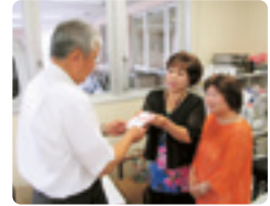
カラオケ・喫茶ひばり