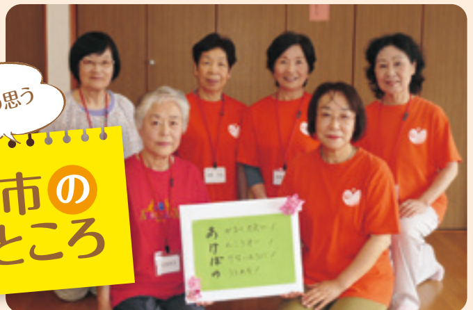
健康体操リーダー(あけぼの)