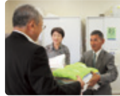
静岡県退職公務員連盟 浜名支部