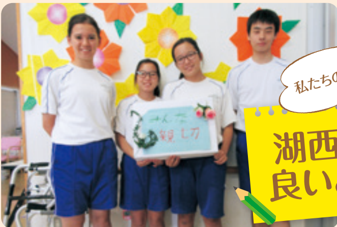
介護センターあらい ちょこっとボランティア