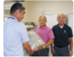
湖西ライオンズクラブ