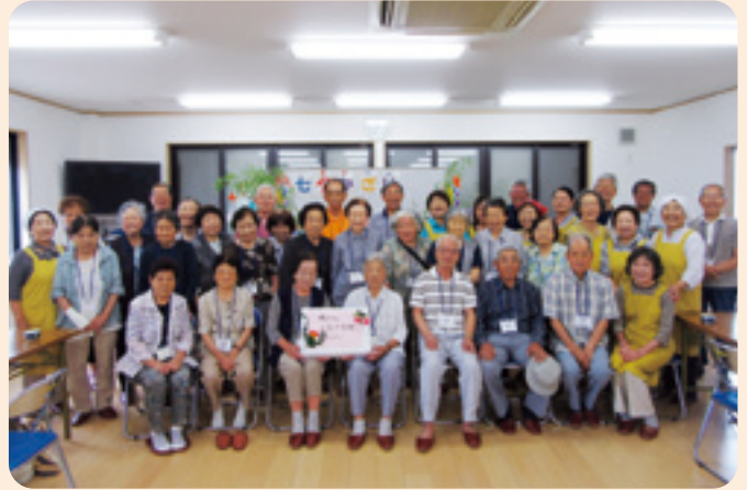
新所原いきいきサロン