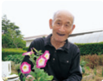
きれいな花に囲まれて