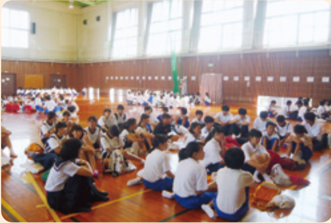
夏休みボランティア体験講座