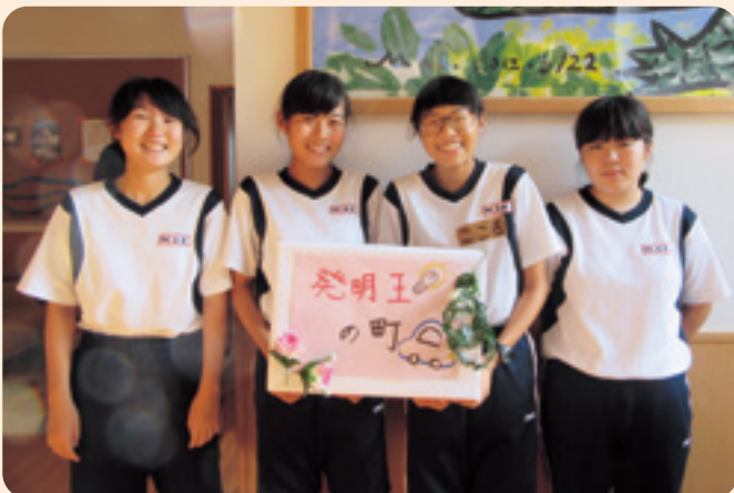
微笑保育園 ちょこっとボランティア