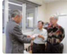
湖西カラオケ愛好会