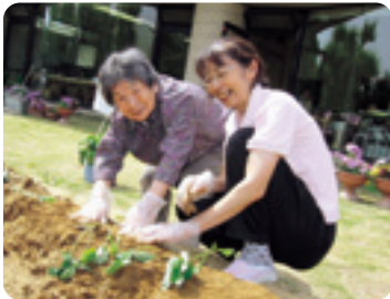
おいしいお芋になあれ♪