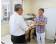
軽音楽愛好会 スケール