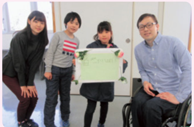
わくわくチャレンジ(障がい学習)