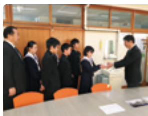
白須賀中学校生徒会