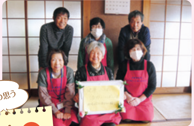
白須賀地区福祉会5区いきいきサロン