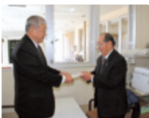
湖西老人クラブ連合会