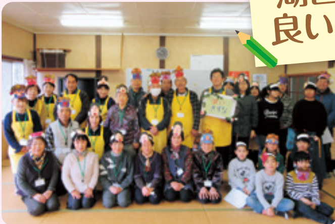
鷺津西地区福祉会坊瀬いきいきサロン