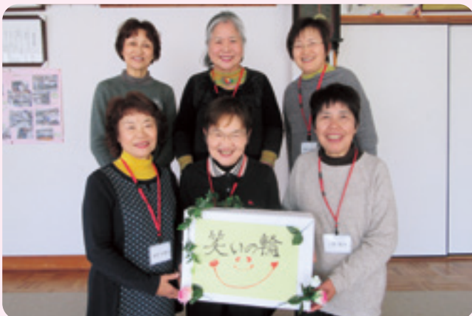
上田町健康体操リーダー