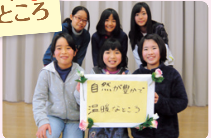
わくわくチャレンジ(高齢者体験)