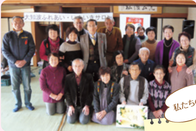
知波田地区福祉会大知波支部