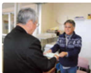
湖西市軽音楽愛好会スケール