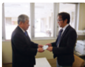
浜名湖電装労働組合