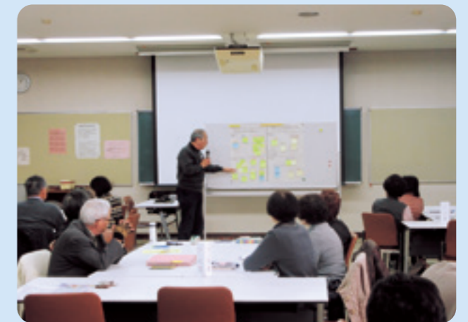
グループ発表の様子

今後、地域に必要な活動として、「地域のニーズ収集」や「ちょっとした困り事の支援」「居場所づくり」などがあげられ、活発な意見が出されました。