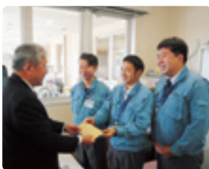
プライムアースEVエナジー(株)