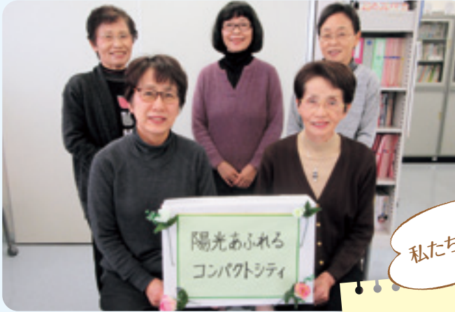
グループ・ともしび