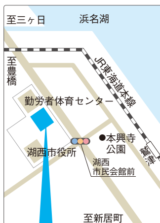
湖西市健康福祉センター おぼと