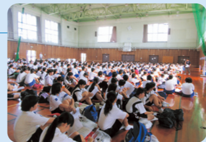
ボランティア体験