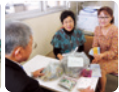
湖西市商工会女性部