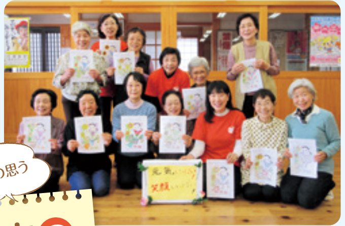
寄ってこ会(古見居場所)