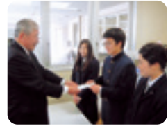
静岡県立湖西高等学校

現金・葉書・切手など 159件 2,759,960円 物品寄付(プルタブ、使用済み切手、ベルマークなど) 497件 プルタブ 560kg (換金額 40,500円)