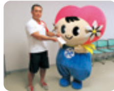
湖西市アメニティプラザ