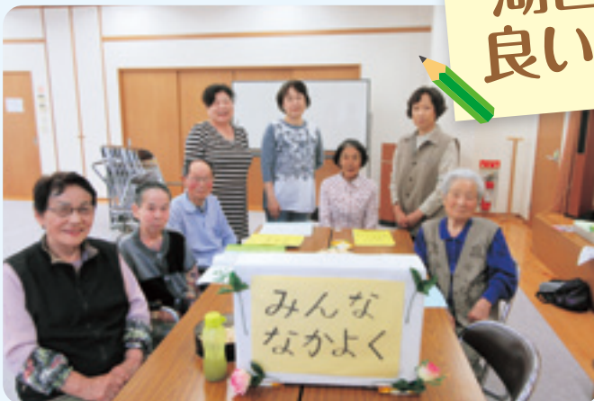
ひろば陽だまり(川尻居場所)