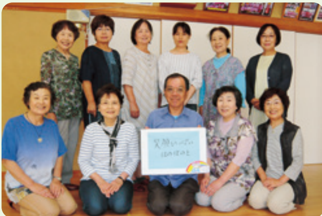
内山地区ふれあいいいききサロン