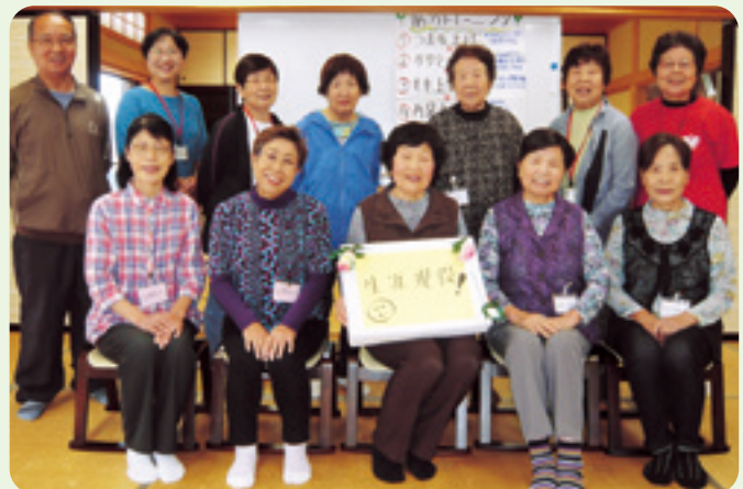
白須賀3区健康体操教室