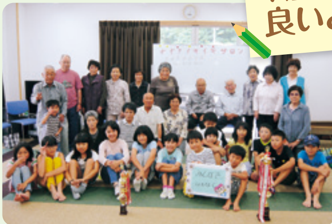
太田地区ふれあいいいききサロン