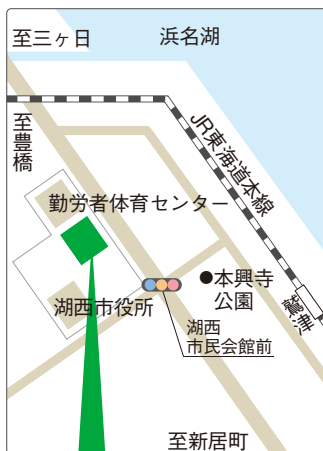
湖西市健康福祉センター おぼと