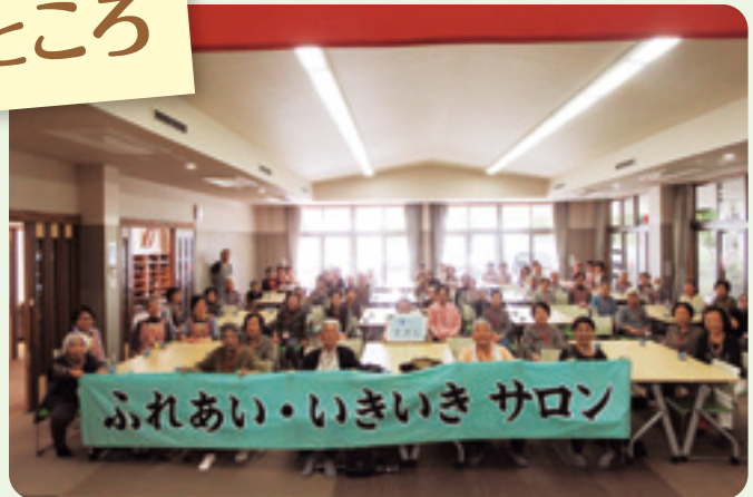
表鷺津地区ふれあいいいききサロン