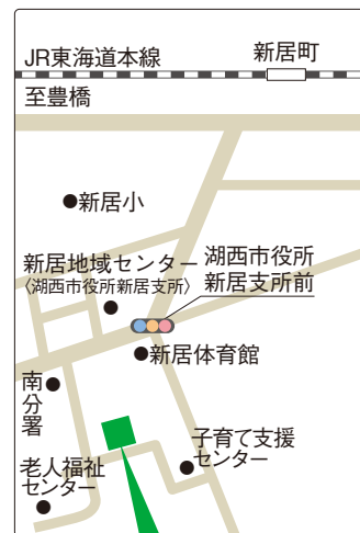
新居介護サービスセンター