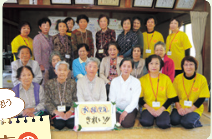
新所地区健康体操教室