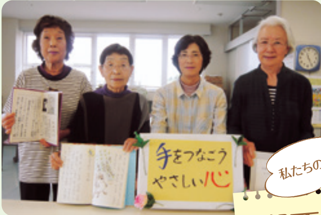
拡大写本ボランティアグループ・ベン