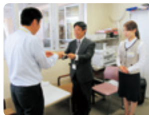
ネットヨタ静浜(株)