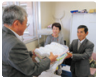
退職公務員連盟浜名支部