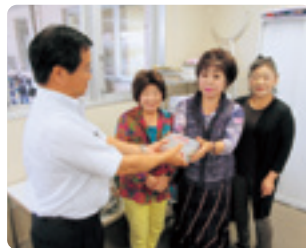
カラオケ喫茶ひばり