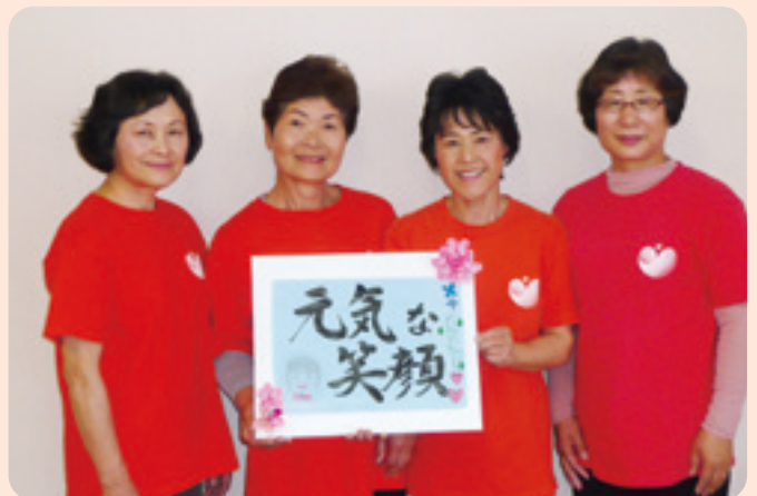
大倉戸健康体操リーダー