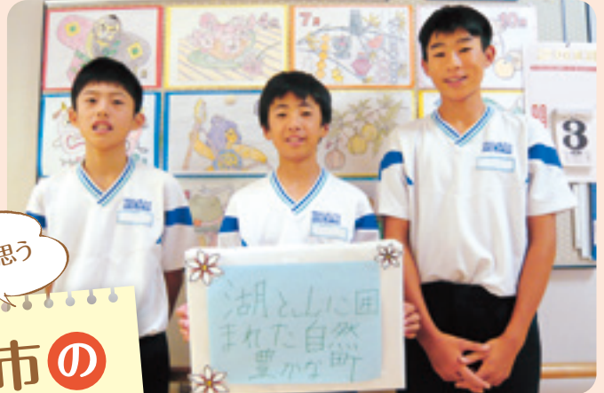
ちょこボラ 介護センターあらい