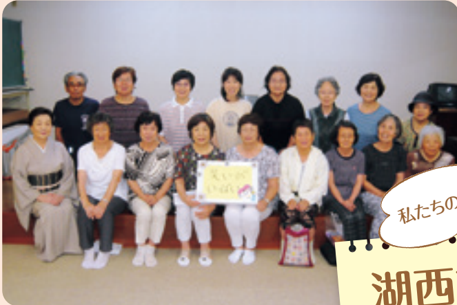
新居中央地区社協サロン