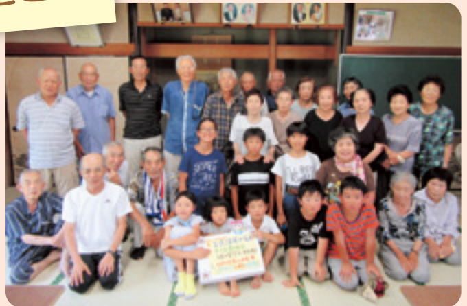
知波田地区社協利木サロン