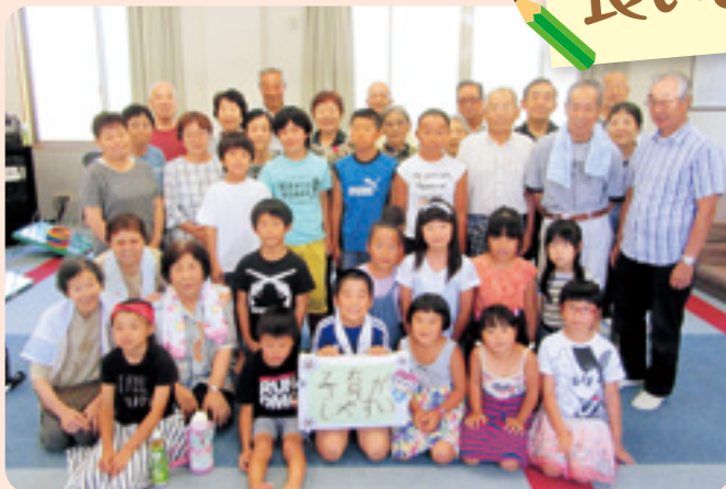
知波田地区社協青平サロン