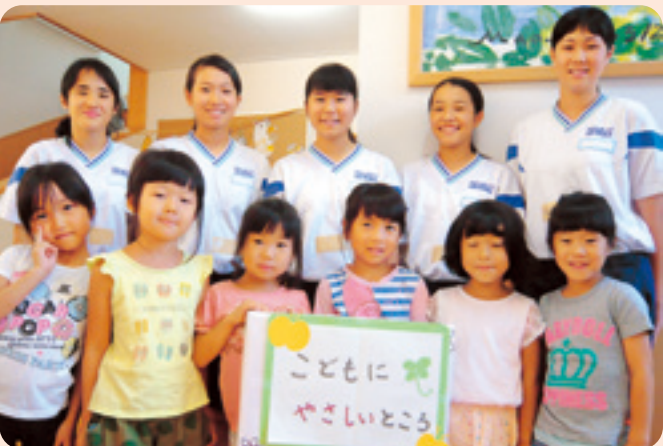
ちょこボラ 微笑こども園