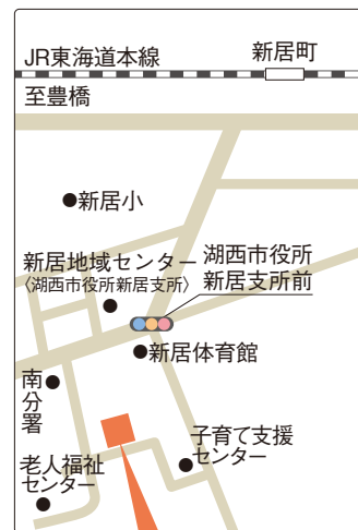
新居介護サービスセンター