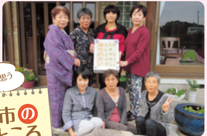
自分史みちサロン