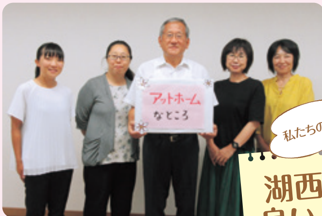
福祉教育実践校連絡会