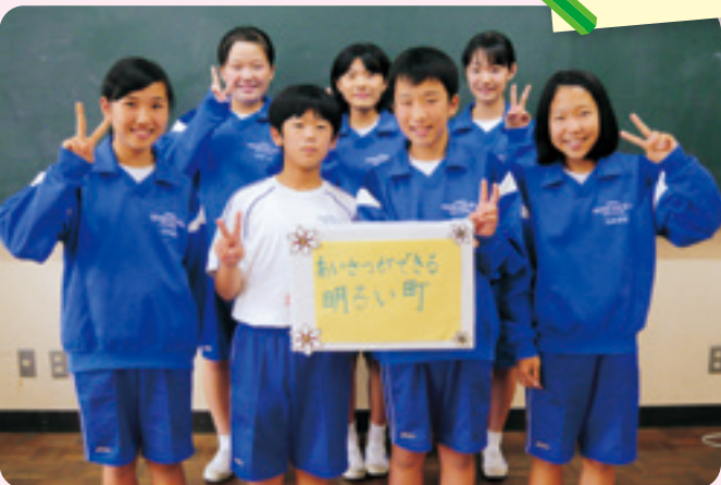
白須賀中学校の生徒(社協出前講座)