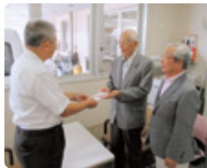
湖西ライオンズクラブ