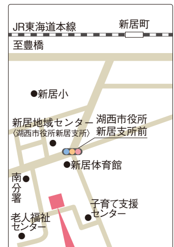
新居介護サービスセンター