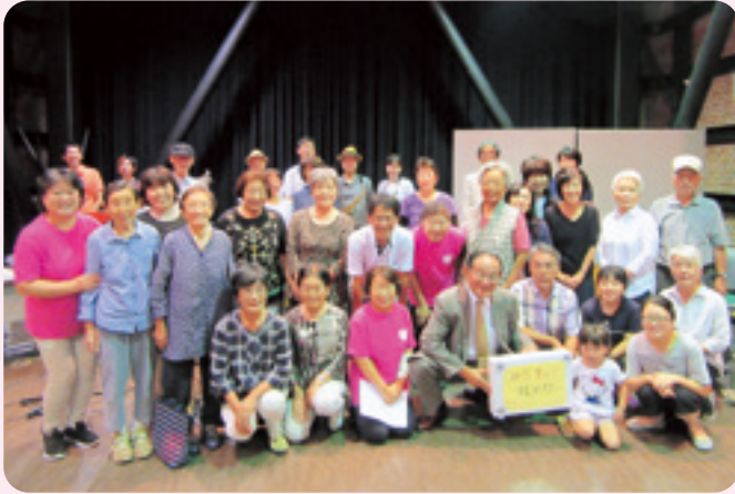
河美地区ふれあい・いきいきサロン