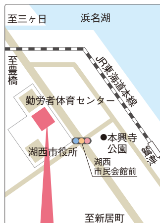
湖西市健康福祉センター おぼと