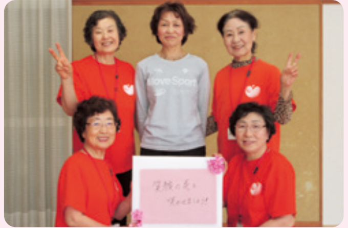
内山地区健康体操リーダー