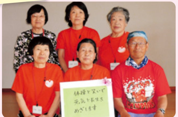
日ヶ崎地区健康体操リーダー