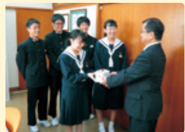
白須賀中学校生徒会(北海道地震災害義援金)