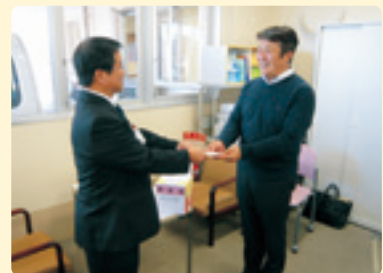
新居町商工会(北海道地震災害義援金)