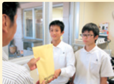
岡崎中学校生徒会(北海道地震災害義援金)

平成29年7月豪雨災害義援金 110円 米原市竜巻災害義援金 100円 平成30年7月大雨災害義援金 6,664円 北海道地震災害義援金 60,220円