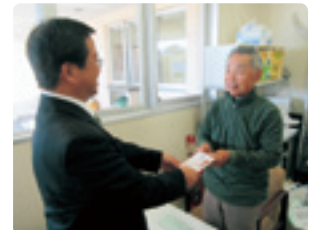
ふたばダンスサークル