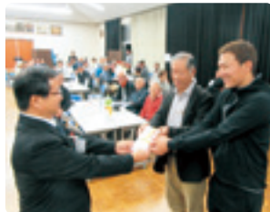
入出ゴルフ愛好会