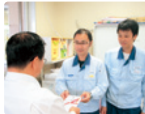
浜名部品工業(株)浜名部品工業労組