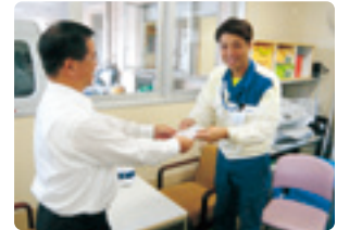
スズキ(株)湖西工場組長会

マックスバリュ東海(株)ザ・ビッグ湖西店 車椅子 ガベージコレクタ 洗濯機、ガスコンロ 匿名 米 匿名 米 匿名 オムツ、トイレトペーパー おしりふき 匿名 ひまわりカード半券 匿名 紙おむつ 匿名 布・糸等 匿名 食料