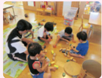
ちょこっとボランティア