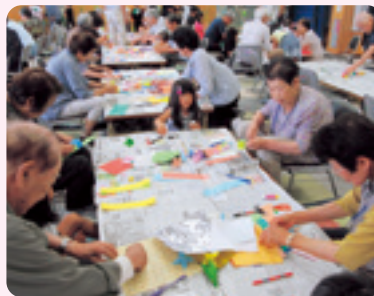
ふれあい・いきいきサロン