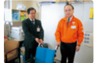
マックスバリュ東海(株)ザ・ビッグ湖西店