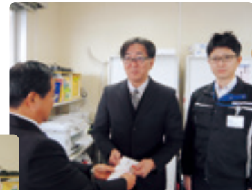
浜名湖電装労働組合