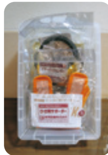
高齢者疑似体験セット