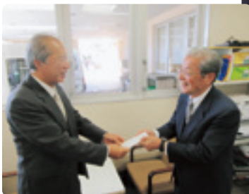
湖西市老人クラブ連合会