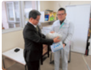
ベルソニカ労働組合