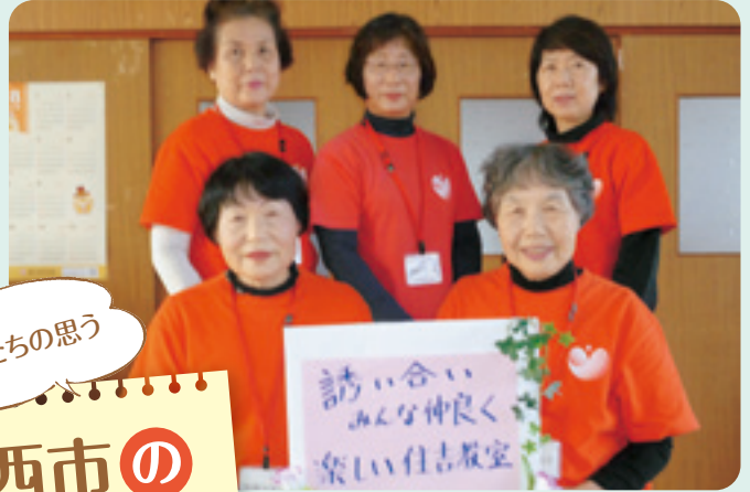
住吉地区健康体操リーダー