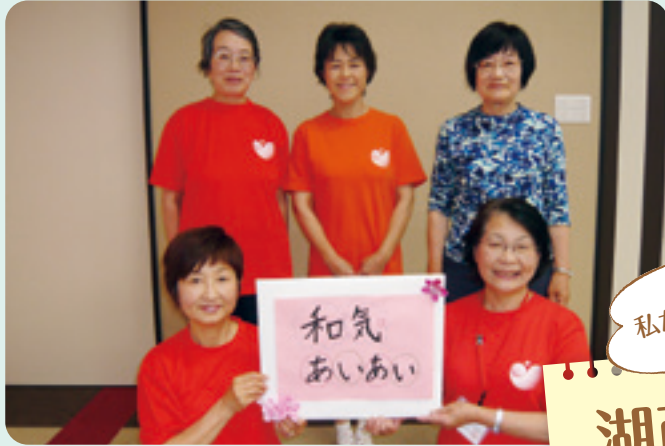
三ツ谷地区健康体操リーダー