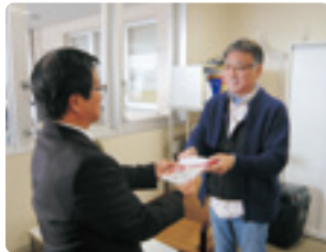
湖西軽音楽愛好会 スケール