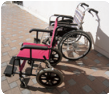
車いす 奥：自操式手前：介助式