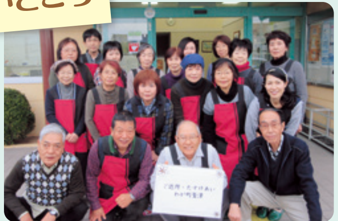
驚津ふれあい・いきいきサロン