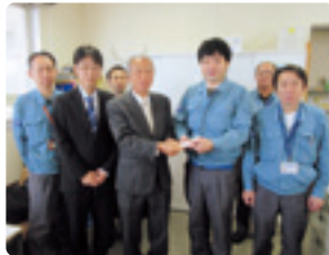
プライムアースEVエナジー(株)