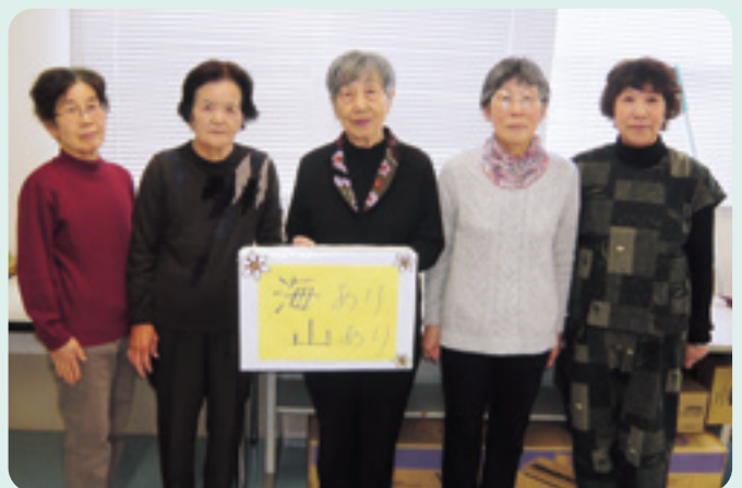
介護支援ぬいものボランティア