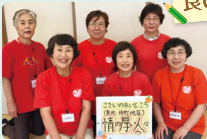
泉町仲町地区健康体操リーダー