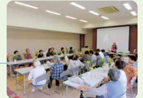
ふれあひいきいきサロン(鷺津)