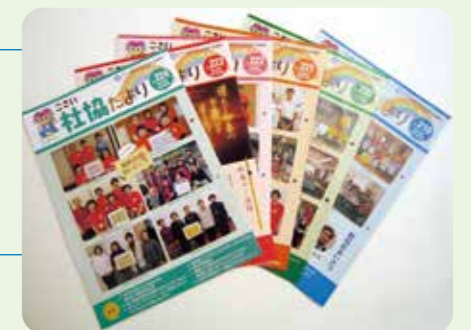
社協だよりの発行