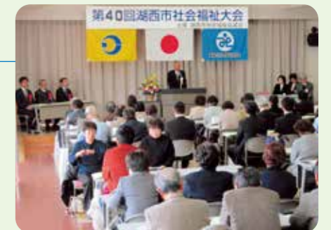
湖西市社会福祉大会