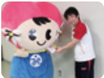
アメニティプラザ