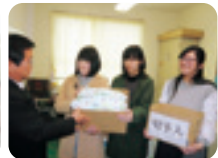
静岡中央高等学校