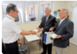
湖西ライオンズクラブ