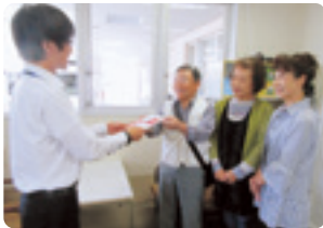
湖西カラオケ愛好協会