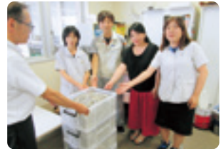
(株)ユニバンス (株)富士部品製作所