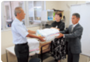
静岡県退職公務員連盟浜名支部