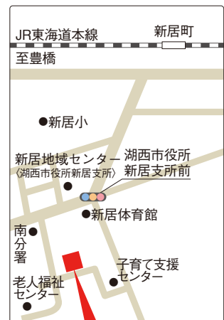
新居介護サービスセンター