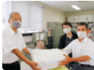
静岡県退職公務員連盟浜名支部