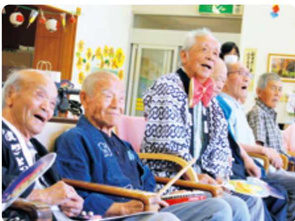
コロナに負けない笑顔がいっぱい!!

事業対象者、要支援1・2の方を対象に、介護予防と生活の充実を目指した通所型サービス「こふくちゃん教室」もあります。コロナ禍でお家にこもりがちの方、ぜひ利用してみませんか?