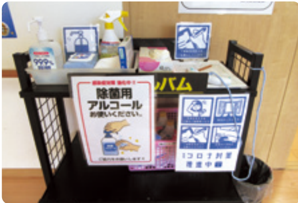
入館時に検温・アルコール消毒を実施

参加者から「安心して参加できる」との声があり、久しぶりの再会に笑顔があふ れていました。