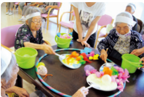
「介護センター夏祭り」で金魚すくい

デイサービスでは入浴や食事・趣味活動・機能訓練などを行うことで、ご利用者の皆さんがその人らしく生き生きと過ごすことができるよう、またご家族の介護負担が軽減できるように支援させていただいています!!コロナ禍の中、感染拡大防止に配慮しながら皆さんの笑顔があふれるサービス提供をしています!!