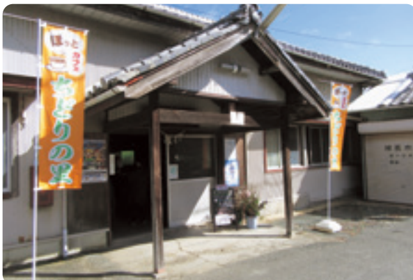
「岡崎公会堂」毎月第4日曜日開催

参加者から「みんな元気で安心した」「毎日外に出ないで、テレビばかり見てい たから再開して嬉しい」などの感想をいただきました。