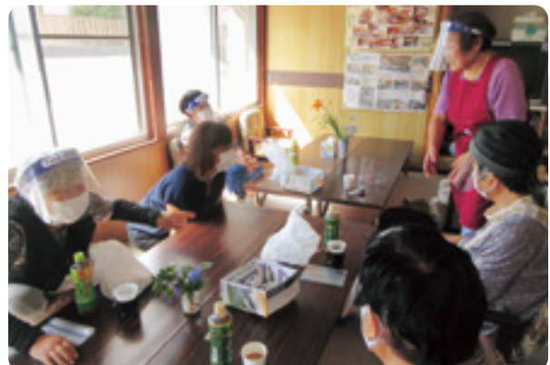
終始笑顔の皆さん