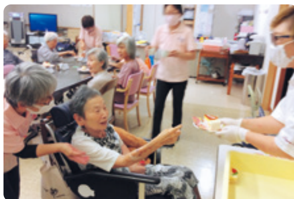
おいしいケーキとコーヒーで喫茶気分!!