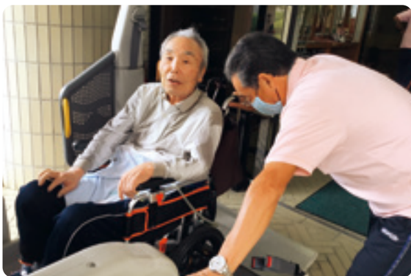
車いすでも送迎は安心・安全です

「人生の先輩を大切にしよう!!」をモットーに、ご利用者の皆さんの笑い声と職員の笑顔がいっぱいの明るく元気な社協のデイサービスです。