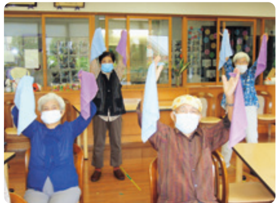
色々な体操を考えて行っています♪