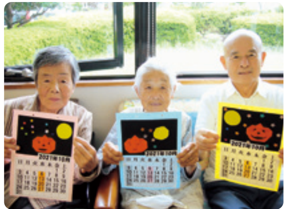
毎月季節に合ったカレンダーを製作しています!