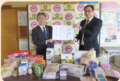
(株)ダイナム静岡新居店