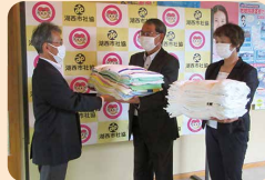
静岡県退職公務員連盟浜名支部