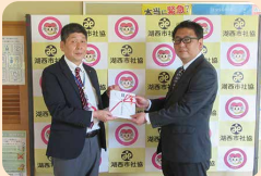
ヤマハ発動機労働組合