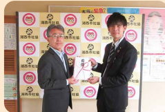
プライムアースEV エナジー株式会社