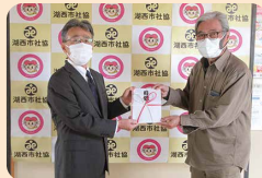
ふれんどサークル