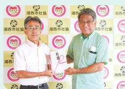
scale (湖西軽音楽愛好会)