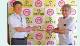
scale (湖西軽音楽愛好会)