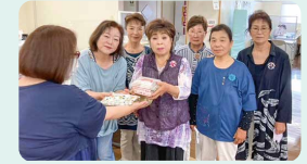
カラオケ・喫茶ひばり