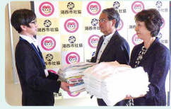
静岡県退職公務員連盟浜名支部