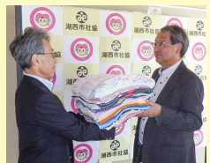
静岡県退職公務員連盟浜名支部