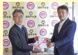
湖西ライオンズクラブ