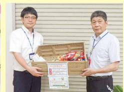
豊橋信用金庫新所原支店